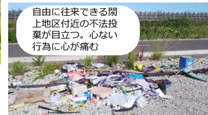
自由に往来できる閑上地区付近の不法投棄が目立つ。心ない行為に心が痛む