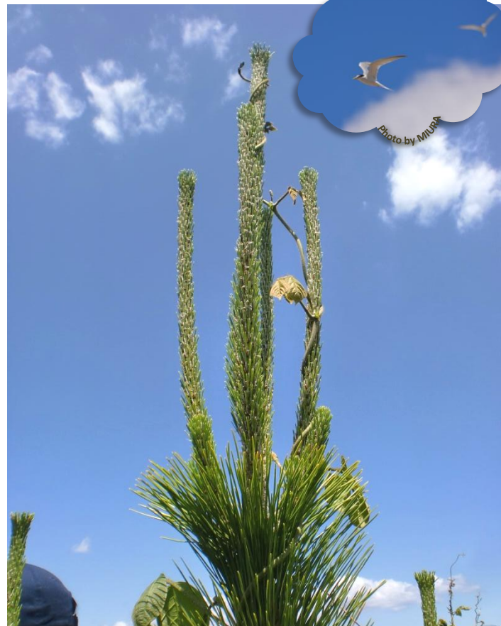
頂芽を伝い、クロマツより高く伸びようとしているクズ。1日30cm伸びるともいわれる。人が足を踏み入れない数カ月間、刈り取られることなく伸び伸びしていたのだから。(右上)越冬地のオーストラリアやアフリカの沿岸から夏鳥として繁殖のために渡ってくるコアジサシ。植栽地近くでひっそり営巣

3月下旬、暖かくなるとともに、現場が動き始め活気づく予定でしたが、4月7日の緊急事態宣言の発出により、他県への移動が制限されたため、東京のスタッフは名取市への出張を控え、全国から集まるボランティア活動は中止し、静かな春を過ごしました。コロナ禍のボランティア受入れ状況、クロマツや動植物の様子、名取市海岸林再生の会や森林組合の作業について報告します。