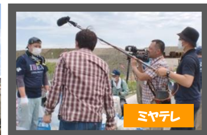
感染対策をしておけるボランティア活動再開について、2012年から継続して取材いただいている宮城テレビから取材を受け、6月22日「OH!パルデス」で約12分間放送された