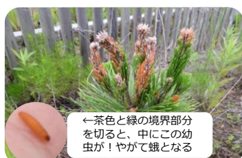
←茶色と緑の境界部分を切ると、中にこの幼虫が！やがて蛾となる

ムシも元気でした！ (上)場所によっては、約半年間、人が踏み入れなかった場所があり、鬼の居ぬ間の洗濯とばかりに約8cmに成長したマツカレハの幼虫を100匹以上発見(下)2019年植栽のクロマツに集中して、先端が枯れているものを多数発見。枯れた部分のみを切り取り対処。これは、マツツマアカシンクイの作業