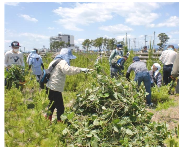
四方八方に自由に伸び、絡みつき、クロマツにとって非常に迷惑な存在を取り除いてくれる救世主が登場。70kgある防風柵を移動させ、クズの根元を探し薬剤を塗布。クロマツを思い黙々と作業してくれるボランティアの存在がありがたい